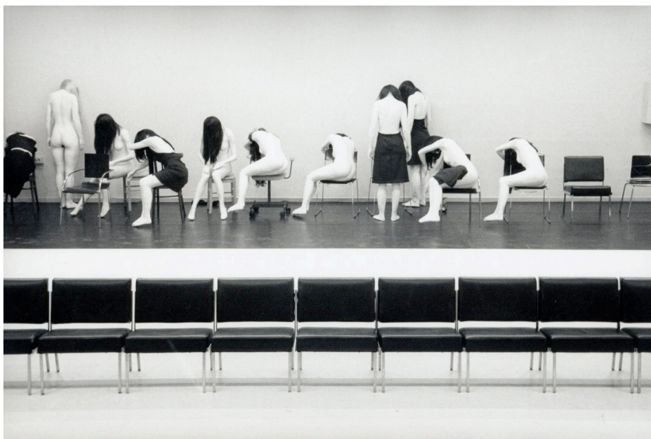
Showroomdummies / Photo Mathilde Darel