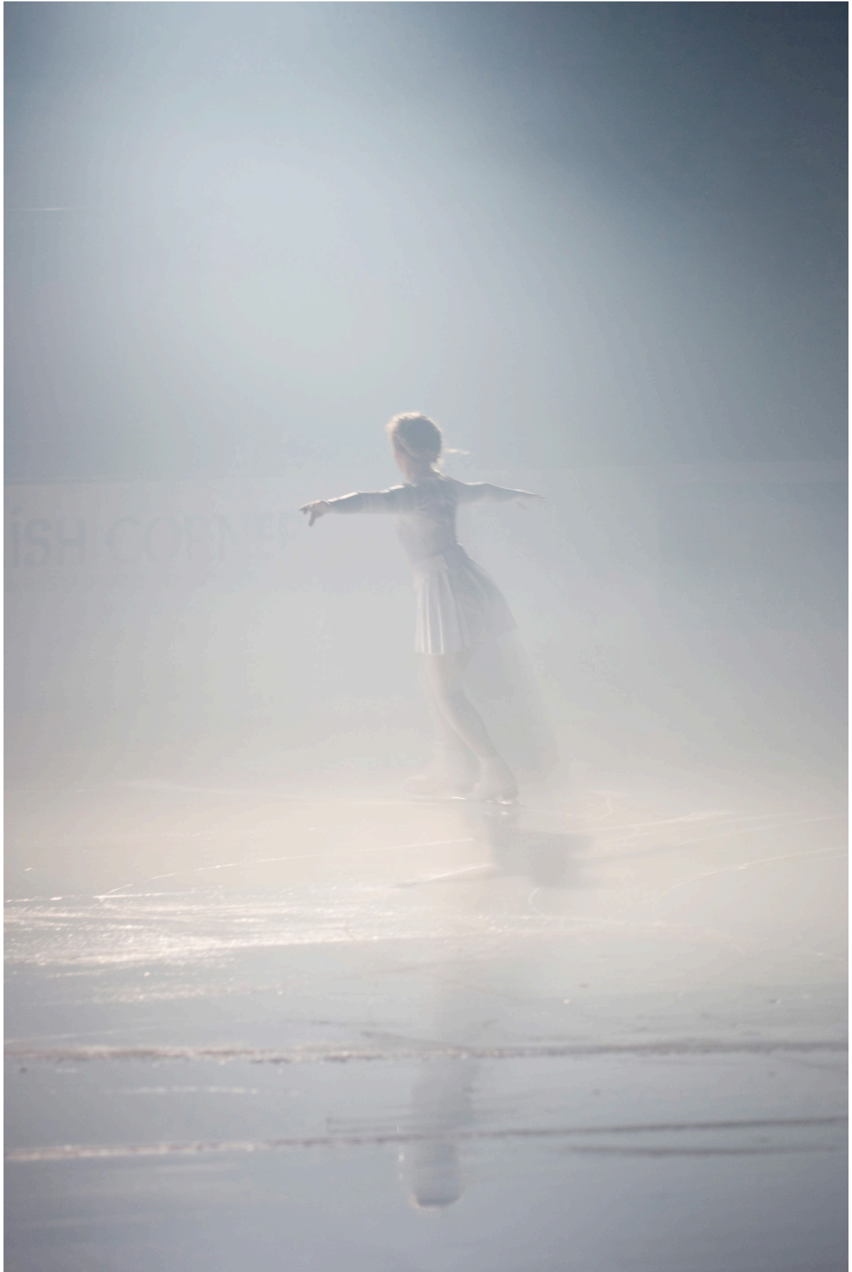
Éternelle idole