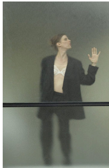
Je voudrais être légère