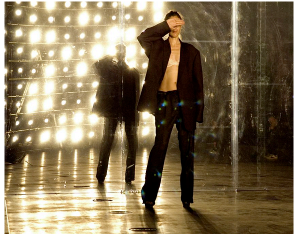
Sens : indifférent. Corps : inutile