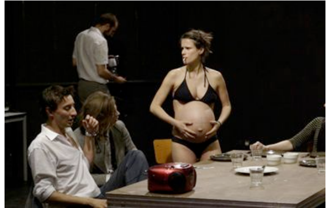
Chiens de Navarre